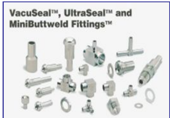
面シール ガasket 継手 (VCR相当)