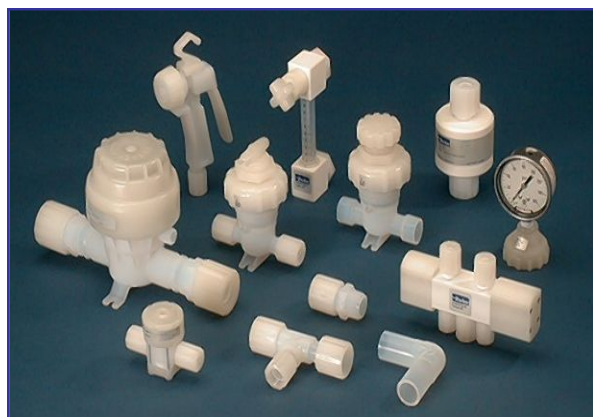
Partek (パーテック) 樹脂製 バルブ/継手