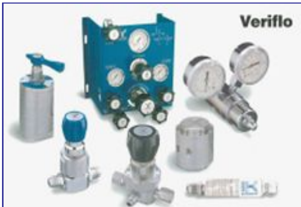
Veriflo (ヴェリフロ) 減圧弁、 バルブ

左記ロゴは全てパーカーハネフィン社製品であり 日本はもとより、世界各地の半導体工場の 製造装置、又各種ガスシステムなどに多数 使用されております。