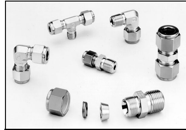
2枚フェルール チューブ継手 (S 社相当)