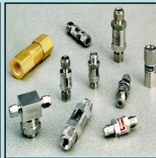
逆止弁及びフィルター