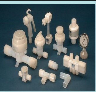
PFA / PTFE 製品